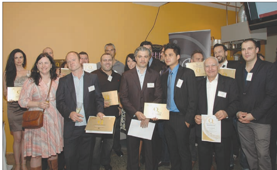
I vincitori del marchio Ospitalità Italiana Ristoranti Italiani nel Mondo dell'edizione 2012 e quelli confermati dell'edizione 2011

Lunedì 3 dicembre, alla Casa Barilla di Sydney, ad alcuni proprietari di ristoranti sono stati consegnati il marchio e l'attestato di "Ospitalità Italiana, Ristoranti Italiani nel Mondo". Si tratta di un'iniziativa di Unioncamere e Camere di Commercio Italiana all'estero, portata avanti in Australia dalla Camera di Commercio Italiana di Sydney, che ha come scopo quello di sviluppare,