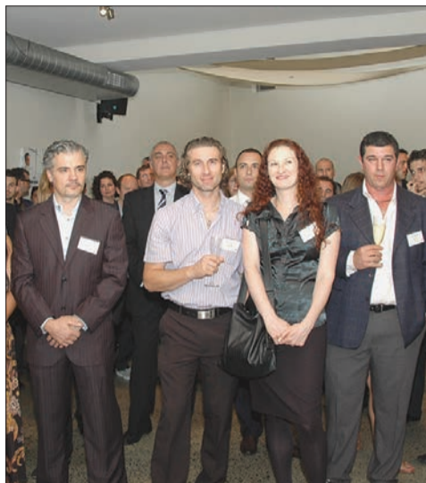
Alcuni partecipanti presenti alla cerimonia della consegna del marchio Ospitalità Italiana